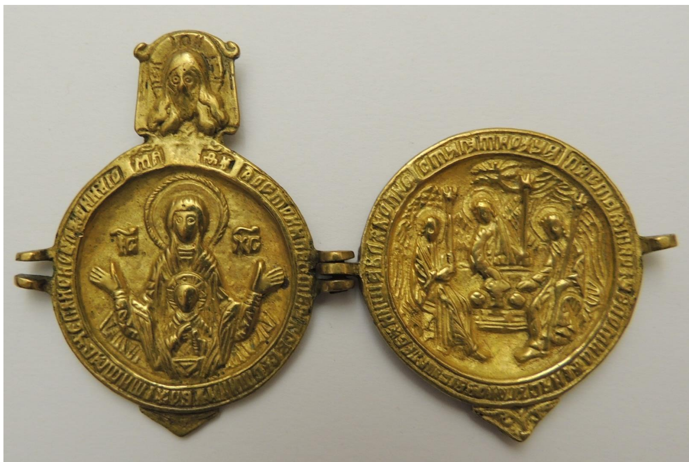
reisicoon 'De Moeder Gods van het Teken'

Zondagmorgen 8 december 2024 - 10.30 uur Tweede zondag van Advent Populus Sion